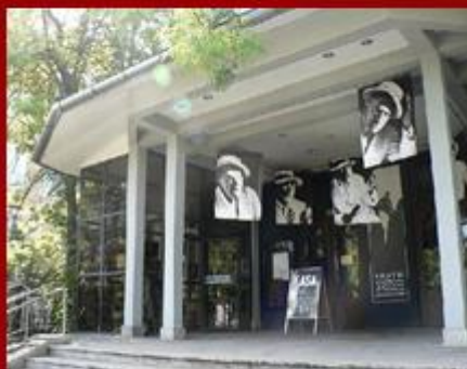
Teatr Witkacego - Zakopane

Projekt współfinansowany ze środków Unii Europejskiej z Europejskiego Funduszu Rozwoju Regionalnego w ramach Miejskiego Regionalnego Programu Operacyjnego na lata 2007-2013