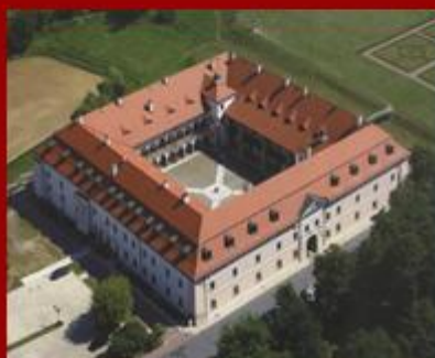
Zamek Królewski - Niepołomice

Projekt współfinansowany ze środków Unii Europejskiej z Europejskiego Funduszu Rozwoju Regionalnego w ramach Miejskiego Regionalnego Programu Operacyjnego na lata 2007-2013