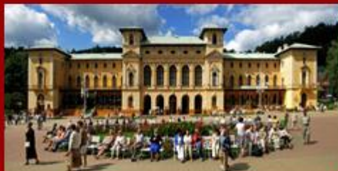
Stary Dom Zdrojowy - Krynica-Zdrój