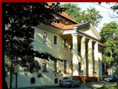
Dwór Zieleniewskich - Trzebinia

III część projektu: 2010 r. - koncerty laureatów Międzynarodowego Konkursu Sztuki Wokalnej im. Ady Sari