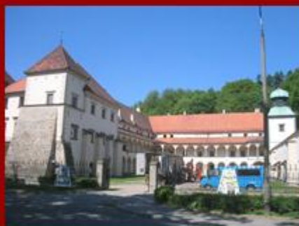
Zamek - Sucha Beskidzka

Projekt współfinansowany ze środków Unii Europejskiej z Europejskiego Funduszu Rozwoju Regionalnego w ramach Miejskiego Regionalnego Programu Operacyjnego na lata 2007-2013