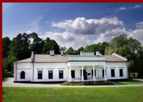
Centrum Paderewskiego – Kąsna Dolna