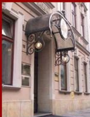
Krakowska Opera Kameralna

Projekt współfinansowany ze środków Unii Europejskiej z Europejskiego Funduszu Rozwoju Regionalnego w ramach Miejskiego Regionalnego Programu Operacyjnego na lata 2007-2013