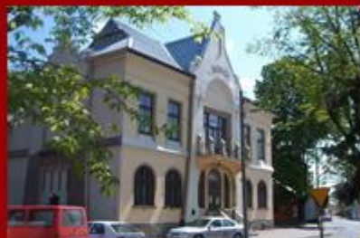
Centrum Kultury i Sztuki im. Ady Sari - Stary Sącz