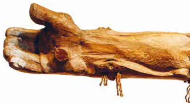
A wooden man, 1979, sculpture/wood, height 250 cm