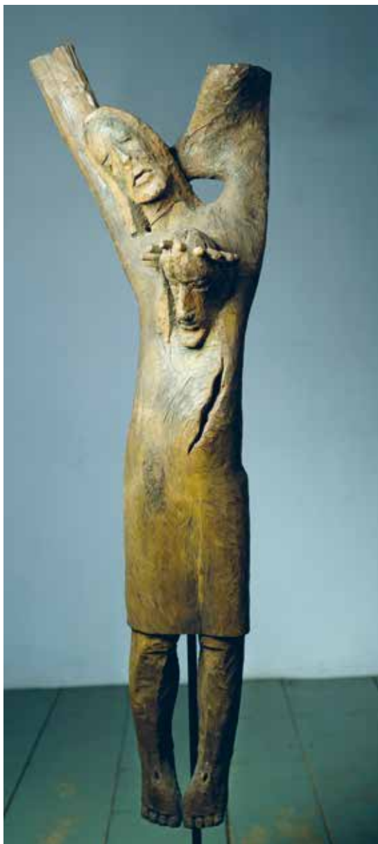
Chrystus, 2 cykl Krzyży, Ciszca, 1963, rzeźba/drewno, wys. 152 cm