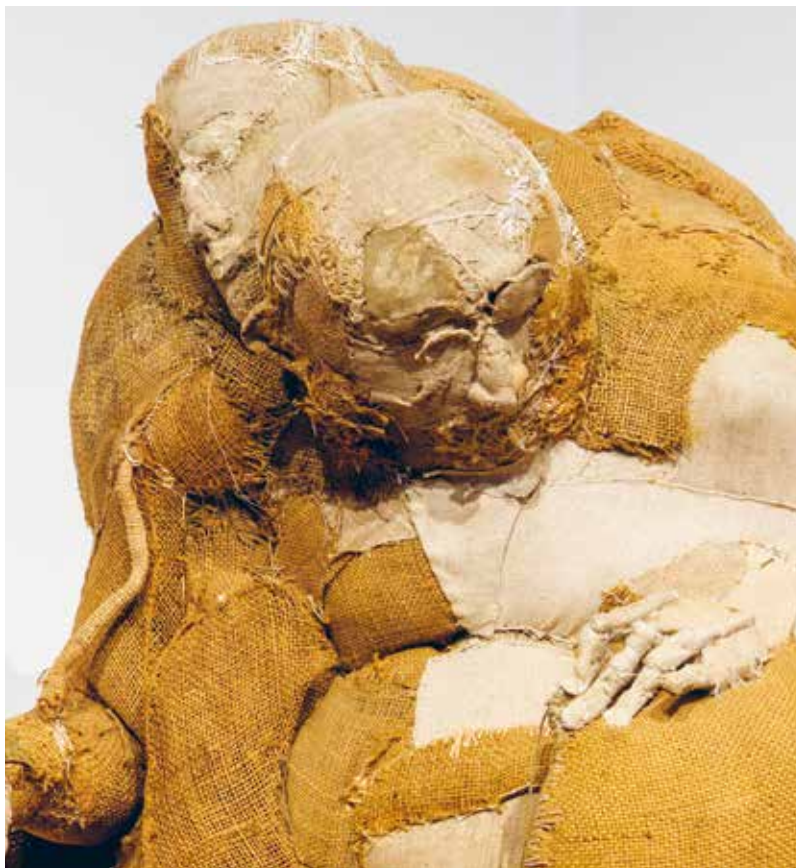
A sewing person, sculpture/fabric, height 115 cm.