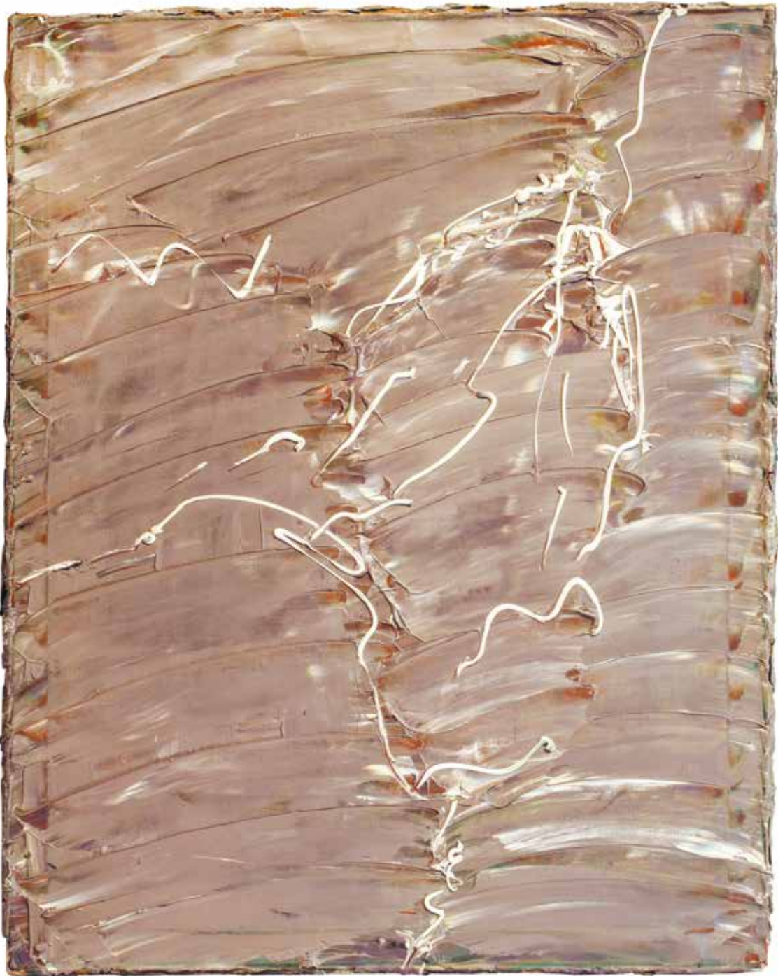
Face, 1974, oil/canvas, 101x80,5 cm From Andrzej Biernacki collection