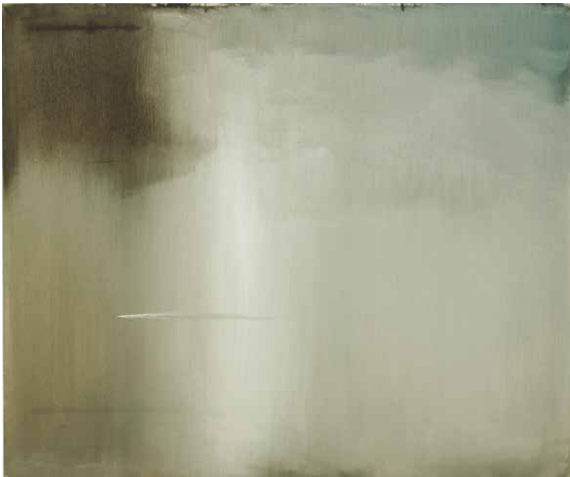
The Bug River , 2014, oil/canvas, 100x120 cm