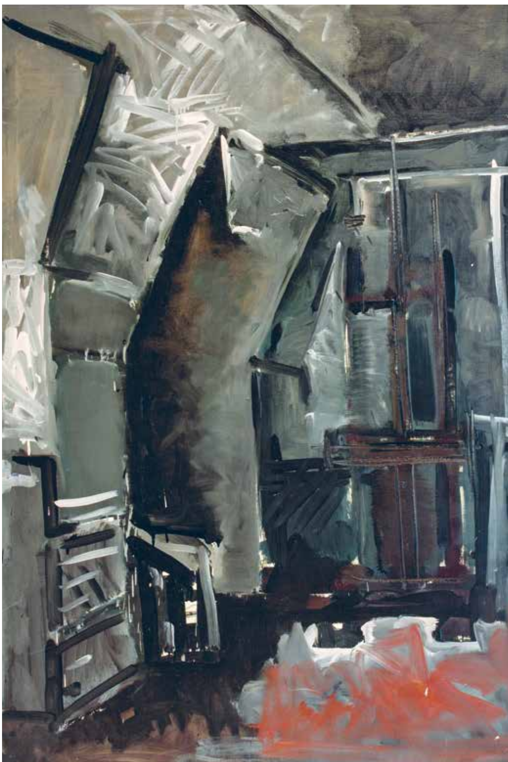
The black inside , 1974, oil/canvas, 160×110 cm From Andrzej Biernacki collection