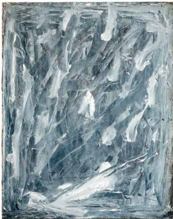
The Crucifixion (blue) , the 1970s, oil/canvas, 100,5×80,5 cm From Andrzej Biernacki collection