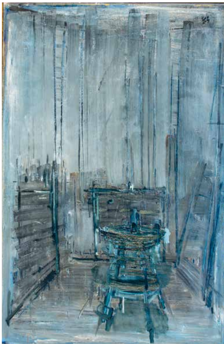
Wnętrze czarne, tragizm Polski , 13.I.1982, olej/płótno, 147×96,5 cm Z kolekcji Andrzeja Biernackiego

The black inside, Poland's tragedy , 13.I.1982, oil/canvas, 147×96,5 cm From Andrzej Biernacki collection