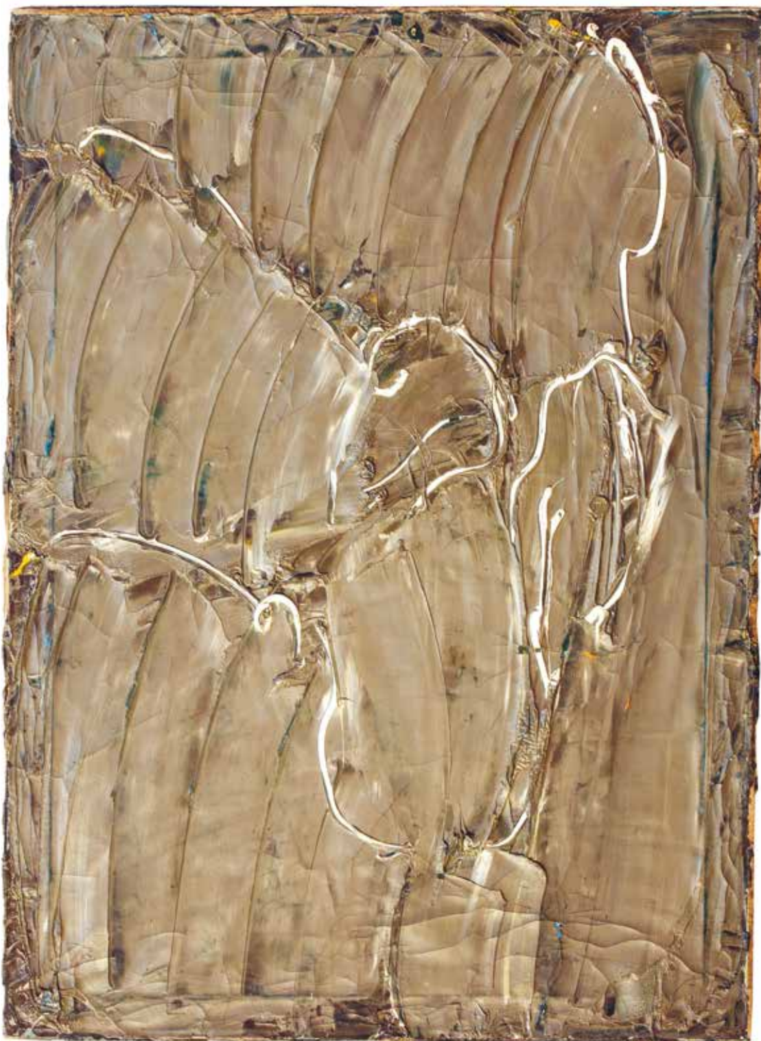
Twarz (ugrowa) , lata 70., olej/płótno, 101×72,5 cm Z kolekcji Andrzeja Biernackiego