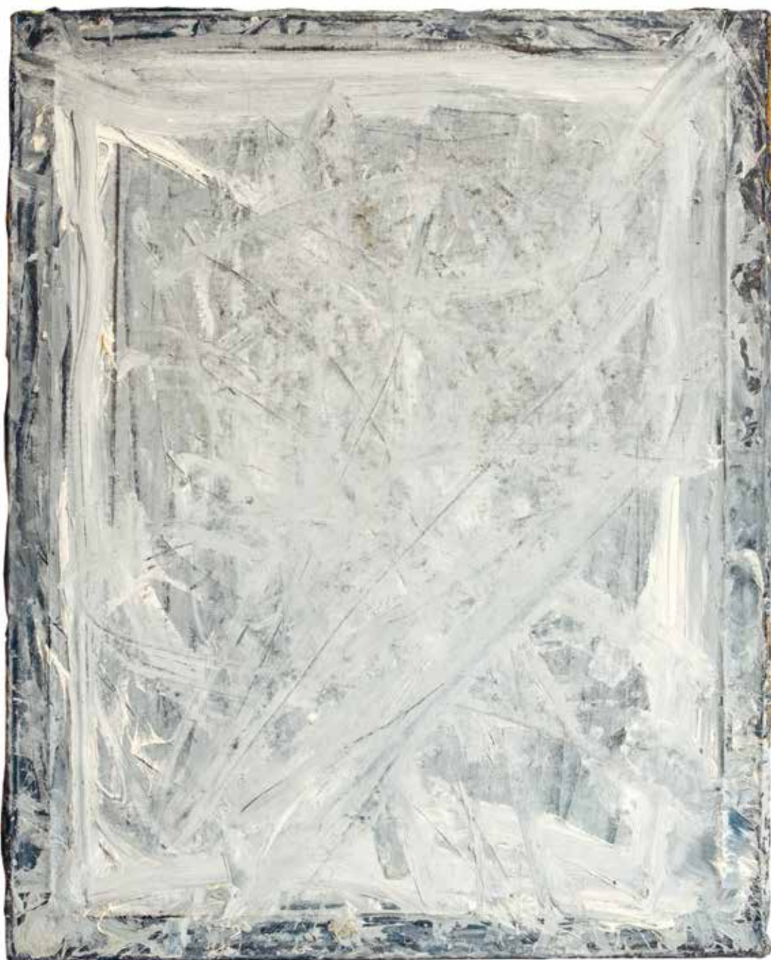
Ukrzyżowanie (szare) , lata 70., olej/płótno, 101×82 cm