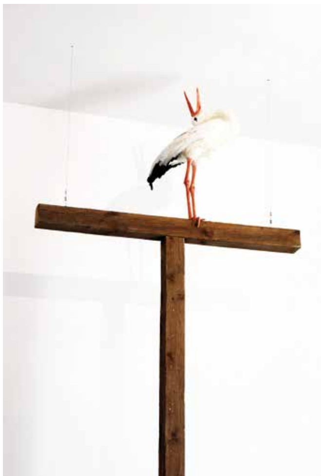
The Polish Cross, sculpture/wood, resin, height 395 cm