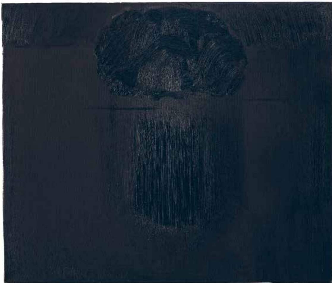
The Bug River, Night , 2016, oil/canvas, 100x120 cm The Bug River , 2016, oil/canvas, 110x170 cm The Bug River , 2016, oil/canvas, 100x120 cm